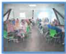
Goûters de la Directrice, moment privilégié d'échanges avec les résidents.