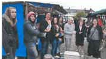
Distribution de tracts sur le marché