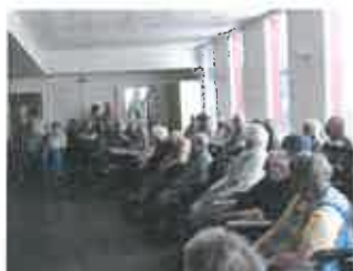
Visite des résidents de l'EHPAD d'Auxy