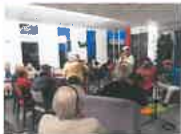
Soirée avec « PEPEE MUSETTE »